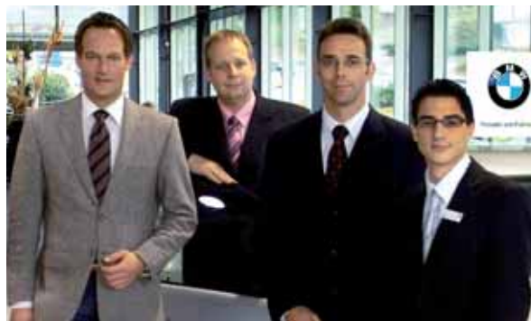
Verkaufsteam Bad Marienberg