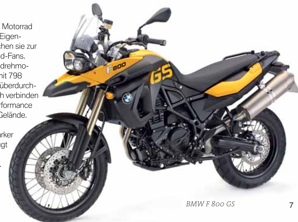
BMW F 800 GS

Maschine für Wiedereinsteiger, die ein agiles, leichtes und unkompliziertes Motorrad suchen. Die deutlich niedrigere Sitzhöhe und das geringe Gewicht machen die Maschine gerade auch für kleinere Personen attraktiv. □