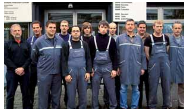
Werkstatt-Team Bad Marienberg