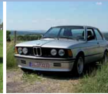
Schmuckstücke des Siegburger Oldie-Clubs