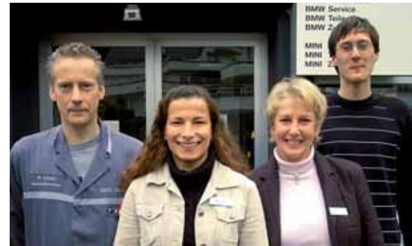
Service-Team Bad Marienberg